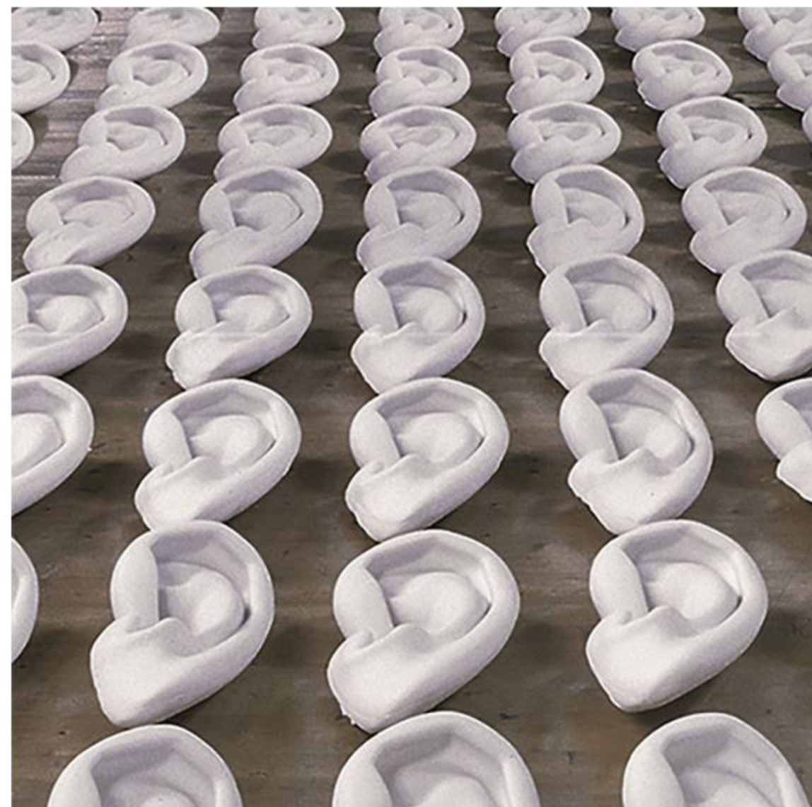
© Hannes Stellner, Installation the carpet too is moving under you , Kunstraum Klosterkirche, 2005

ERÖFFNUNG 03.11.2018, 19 – 21 Uhr ORT designbüro x-height Sedanstr. 1, Rosenheim